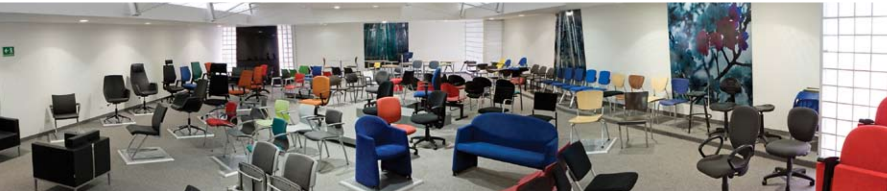
Kassani Diseño, nuevo show room, Bogotá

Todas las sillas están compuestas por materiales como metal, madera, plástico, textiles, espumas, cueros y vinilos. En Kassani, estos materiales y la tecnología están al servicio de la creatividad y el buen diseño.