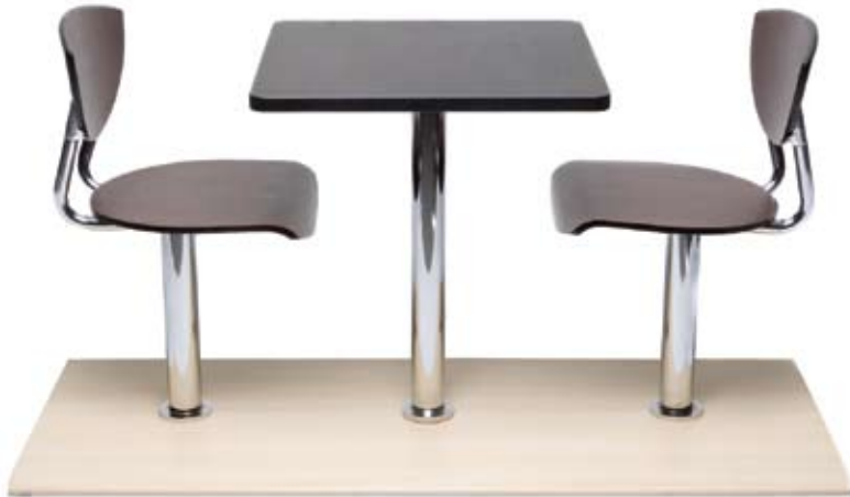
Frappe. Tándem anclado a piso, enchapado en fórmica con herraje de aluminio inyectado.

Con nombres que evocan las más deliciosas bebidas, en las que contrastan el frío y el calor, Kassani ofrece al mercado dos nuevos diseños de mobiliario para plazoletas de comidas, donde se imponen los ambientes armoniosos y confortables.