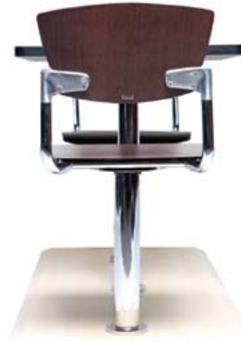
Mokka. Tándem anclado a piso, enchapado en fórmica con herraje en aluminio fundido.

Los tándem Frappe y Mokka están elaborados en materiales que cumplen con las especificaciones para superficies de comedores con acabado melamínico: enchapados, balance en la cara inferior, cubre canto antichoque en perfil de PVC rígido, pegue por hot melt .